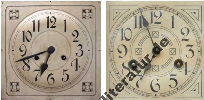
Abbildung 9.10: Zifferblätter im Geometrisch abstrakten Jugendstil

Beispiele für den Geometrisch abstrakten Jugendstil: