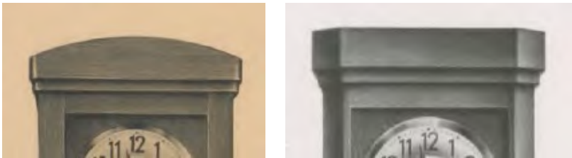
Abbildung 9.16: Beispiele für oberen Uhrenabschluß im Art Déco