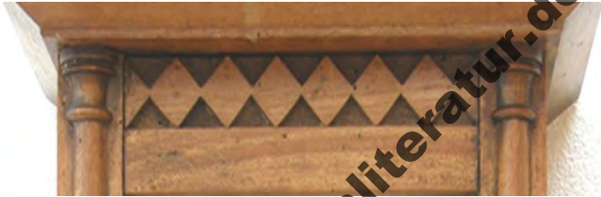
Abbildung 9.13: Geometrische Elemente, hier Rechtecke als Zierleisten