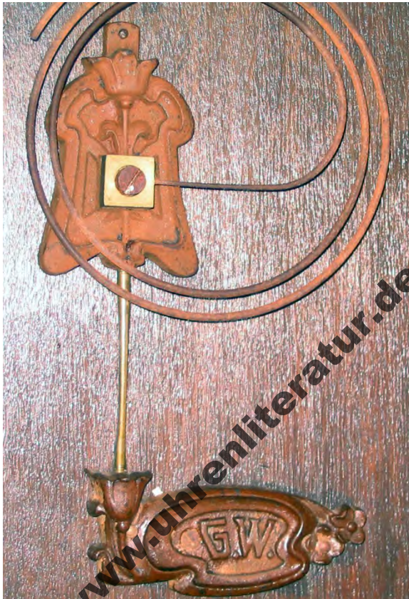
Abbildung 9.9: Beispiel eines Gongs im Organisch floralen Jugendstil (Gebr. Wilde 1903 -1908)