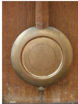
Abbildung 9.11: Typische Geometrisch abstrakte Jugendstilpendel