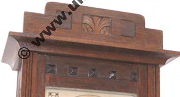
Abbildung 9.14: Geometrisch, abstrakte Motive in die Fläche eingearbeitet