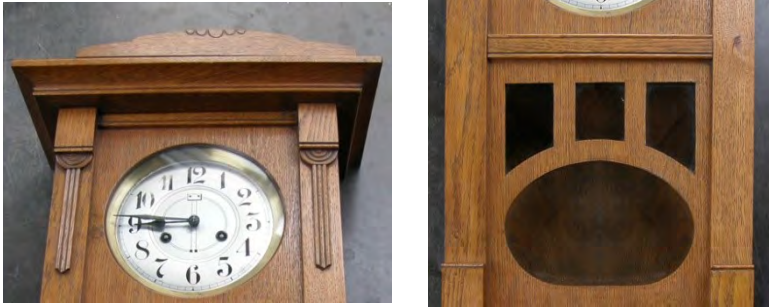
Abbildung 9.12: Rillenornamente und durchbrochene Verkleidungen

Dies ist ein Auszug aus einem Fachbuch, welches Sie hier erwerben können: www.uhrenliteratur.de